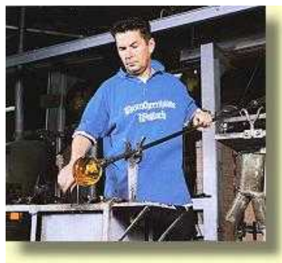
Dorotheenhütte Museum über Glasbläserei bei Wolfach