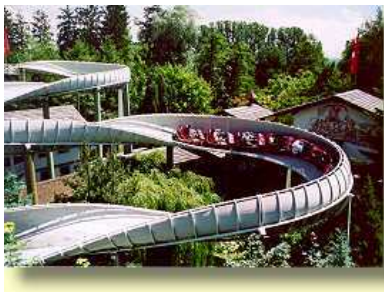
Europa Park – Deutschlands größter Freizeitpark ca.70 km