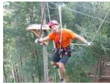
Abenteuerpark und Badeparadies ca. 19 km