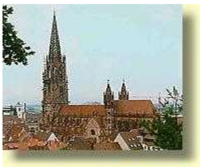
Freiburg 35 km Stadtbesichtigung

Natürlich gibt es noch viele weitere interessante Ausflugsziele die hier nicht aufgeführt sind.